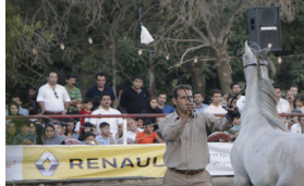
جای خالی رسانه ها در جشنواره کشوری زیبایی اسب