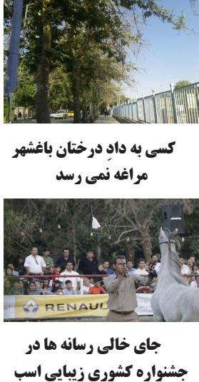
کسی به داد درختان باغشهر مراغه نمی رسد

پیروی گفت: کلیه های مرحومه برای پیوند به تبریز و کبد وی نیز به شیراز منتقل شد. پیکر این نیز در زادگاهش روستای چکان مراغه به خاک سپرده شد.