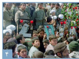
برک هایی از تاریخ دفاع مقدس