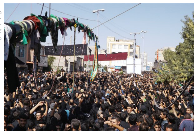
علم عزا در عجبشیر

در این آیین دسته جات عزاداری حسینی در روز سوم محرم در کنار علم های حسینی شروع به خواندن نوحه و مرثیه سرایی کرده و با تجمع در اطراف حسینیه ها، آیین افراشتن علم را برگزار می کنند.