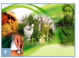
نگاهی به طب سنتی