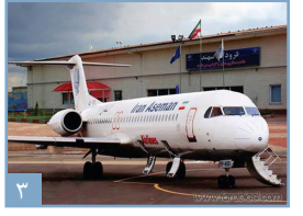
پرواز را بخاطر بسیار! گزارشی از سرگذشت فرودگاه مراغه

رئیس اداره فرهنگ و ارشاد اسلامی خبر داد؛ مراغه صاحب «خانه مطبوعات» می شود